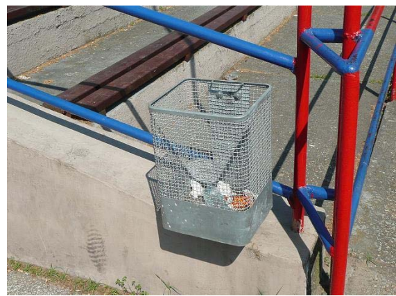
A pálya területén 10db új kukát helyeztünk ki