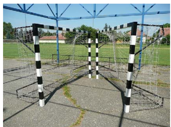
Két új kaput is készítettünk, mert a létszámok miatt szükség van rá.