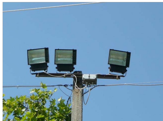
Az alsó és felső pálya világítását már sikerült takarékos, de hatékony világító testekkel felszerelni, összesen 24db-al.