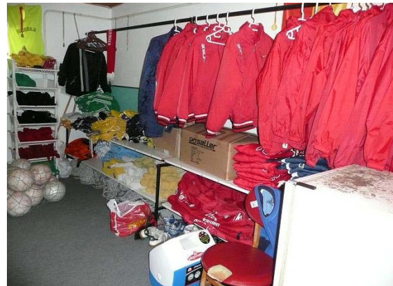
Foci szertárban praktikus tárolórendszert alakítottunk ki.