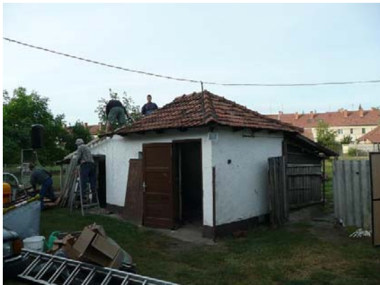
A régi tyúk és disznó ól, alkalmatlan és balesetveszélyes volt a gépek tárolására, ezért lebontottuk.....