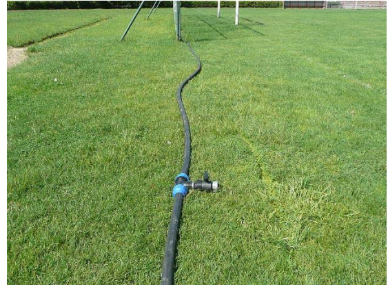
Az alsó és felsőpályánál kiépítettünk egy-egy vízkiosztórendszert, ahonnan könnyen meg tudjuk táplálni az öntöződobot