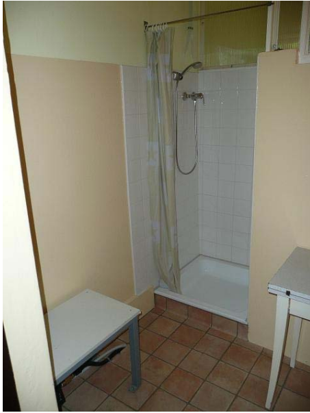
A bírói helyiséget korszerűsítettük egy tusolóval, padokat és fogast helyeztünk el