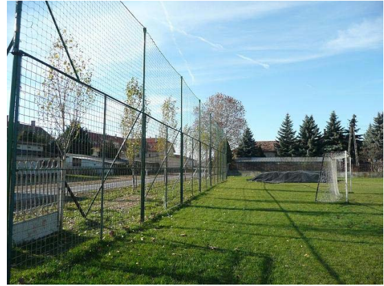
Az alsó pályán megépítettük a kapuk mögötti labdafogó hálót, ami egyben kerítés is a csatorna felől.