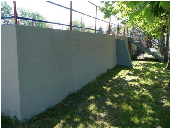
A praktikumok mellett szépítünk is, a lelátó oldalát bepucoltuk, majd lefestettük