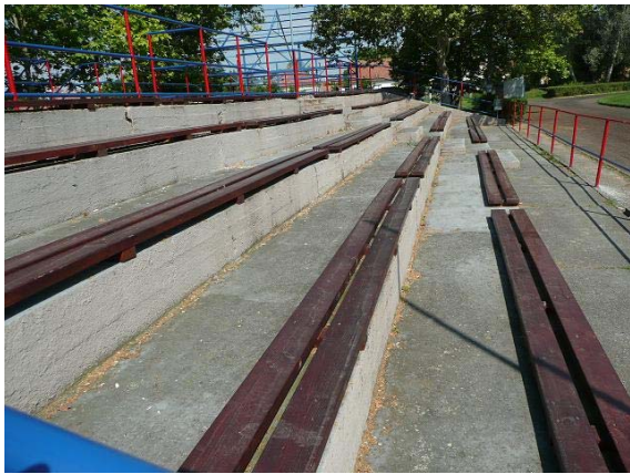
A lelátó padjai már alkalmatlanok voltak a szálla mentes ülésre, ezért mind a 40db padot kicseréltük.