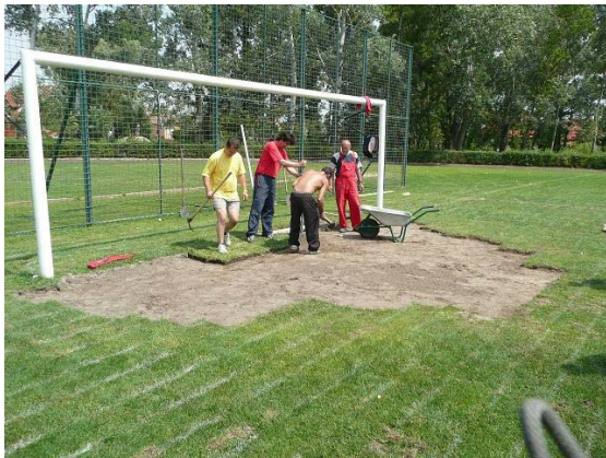
A másik nagyobb társadalmi megmozdulás, a kapuk előtti kikopott rész feljavítása gyeptéglával.