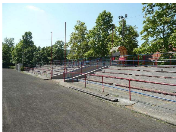
Beton festés, korlát festés, új padok, ápoltság futópálya, szép zöld dús fű már csak a jó meccs kell, de abból is volt bőven.