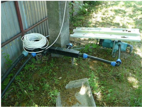
Az alsópálya szivattyújáról történik az új fák, a sövény és az alsópálya fűvének az öntözése.