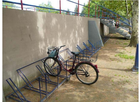
Saját tervezésű 50 állásos bicikli tárolót készítettünk, ami óvja a kerékpárok festését és könnyen lezárhatóak.