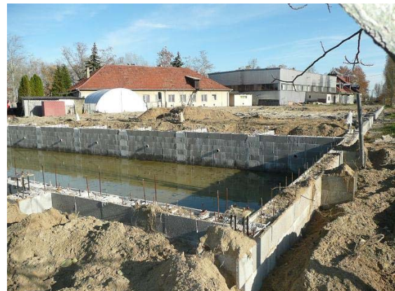
A Rekreációs Központ jelenlegi állapota, föld feltöltés és egyengetés után leáll az építkezés, majd tavasszal folytatjuk.