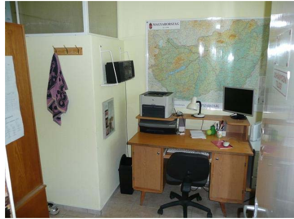
Tusoló mérettel csökkent a tanári, de kárpótlásul azt is szépen felújítottuk.