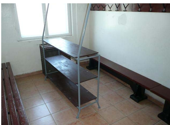
Az öltözőbe plusz polcos ,akasztós állványt raktunk be, a jobb helykihasználás miatt