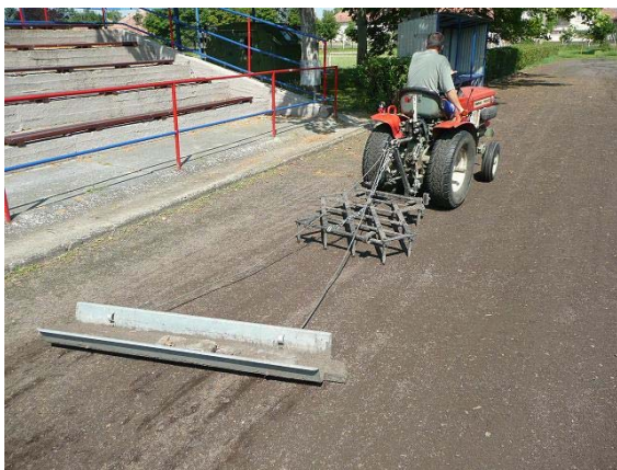
A futópálya folyamatos karbantartást igényel, hogy ne gyomosodjon el és hogy ne keményedjen le, ezt boronálással, símitózással és hengerezéssel tudjuk elérni. Ennek köszönhetően délutánként igen sok sportolni vágyó személy rója a köröket.