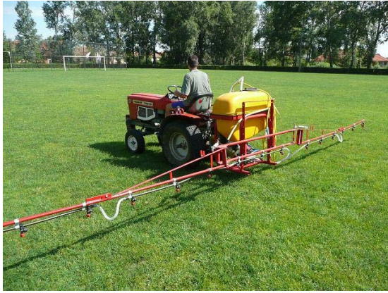
A füvespályák gyomirtózását, lomb-Trágyázását, függesztett konzolos permetezővel végezzük