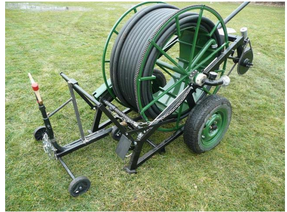
Saját fejlesztésű programozható, villanymotor meghajtású öntöződobbal, energia takarékosan tudunk öntözni.