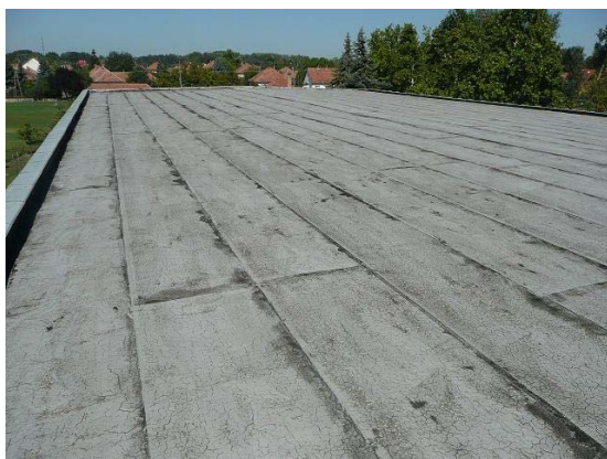
A kiscsarnok tetőzetén lévő hibák miatt rendszeresek voltak a beázások, ezeket sikerült megszüntetni.