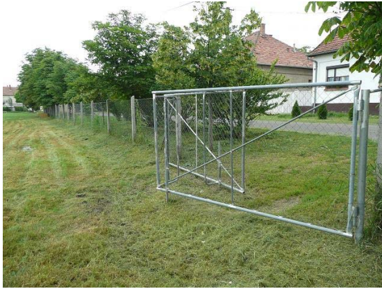
A sport utca felől új kerítést és kaput csináltunk, korlátozva csak mint személyi bejáró, szükség esetén teher bejáró is.