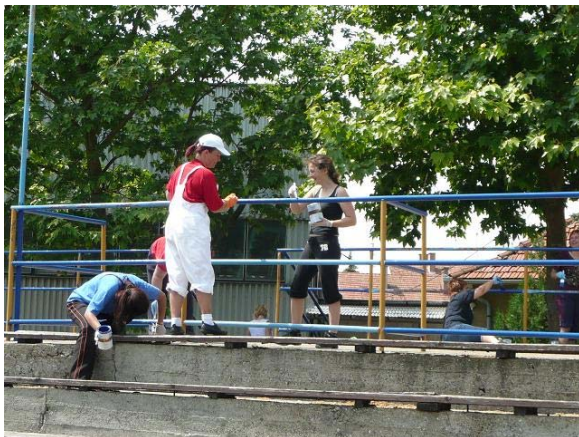
Volt amit társadalmi munka keretében végeztünk el, az egyik a lelátók csőkorlátainak a festése.