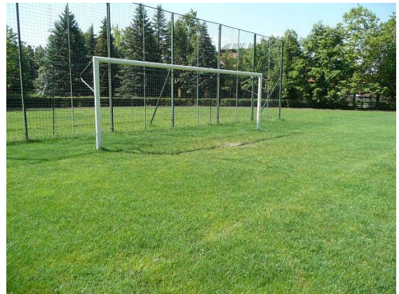
Jól sikerült, azóta is vigyázunk rá.