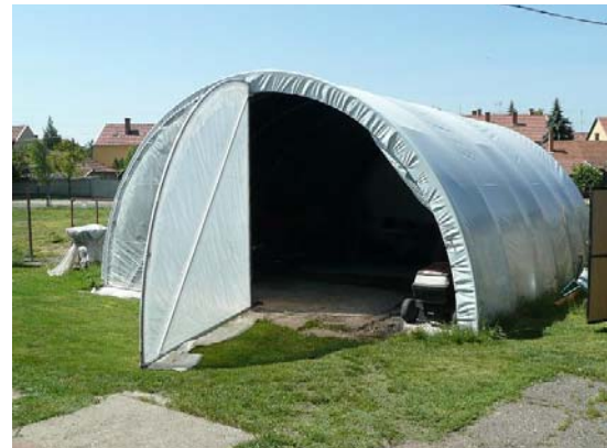
és új 60m 2 -es fólia borítású raktárt építettünk helyette.