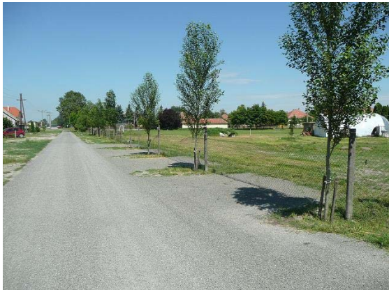
Legnagyobb, leghasznosabb befejezett beruházás a sportpálya melletti földesút felújítása és az öntözött fasor telepítése.